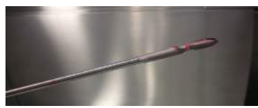
FOTO 1: FLEXIBLER KNOCHENMARKSBOHRER, DER BIEGSAM IST UND INNEN GEBÜRSTET UND GESPÜLT WERDEN MUSS.